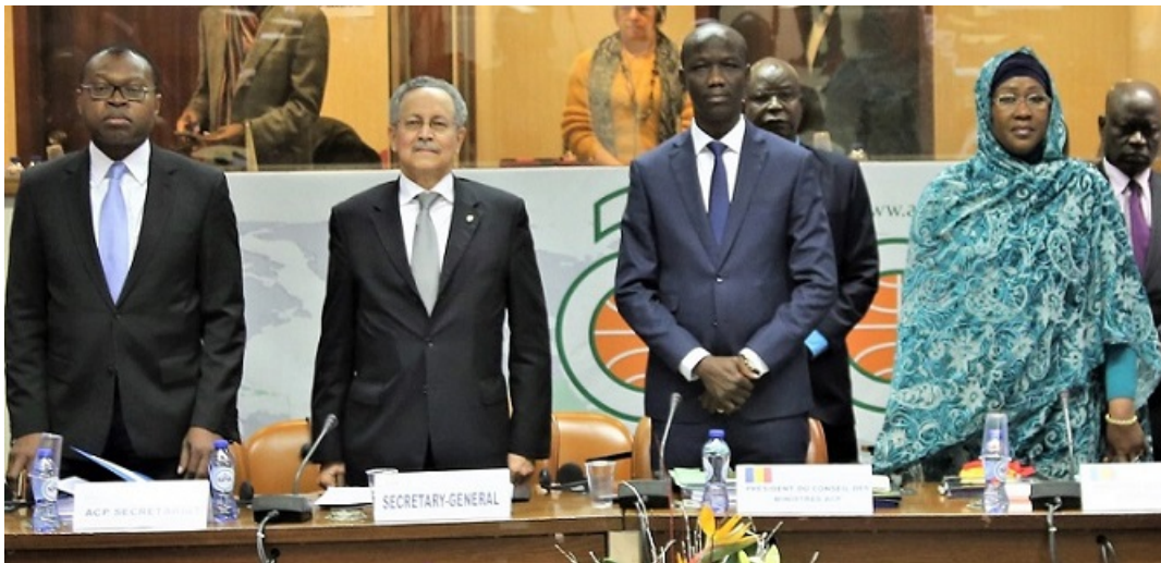
PHOTO OF THE DAY: Opening Ceremony of the 108th Session of the ACP Council of Ministers